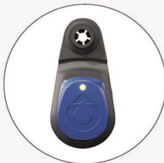
Øretransponder Har LED-lys som blinker når et dyr bør følges opp.

Det finnes én SenseHub-variant for mjølkeku (SenseHub Dairy) og én for ammeku (SenseHub Cow Calf), mens SenseHub Dairy Youngstock overvåker kalvens helse fra fødselen og fram til første inseminering. Systemet kan tilpasses dine behov, alt etter hva du ønsker å overvåke i din besetning.